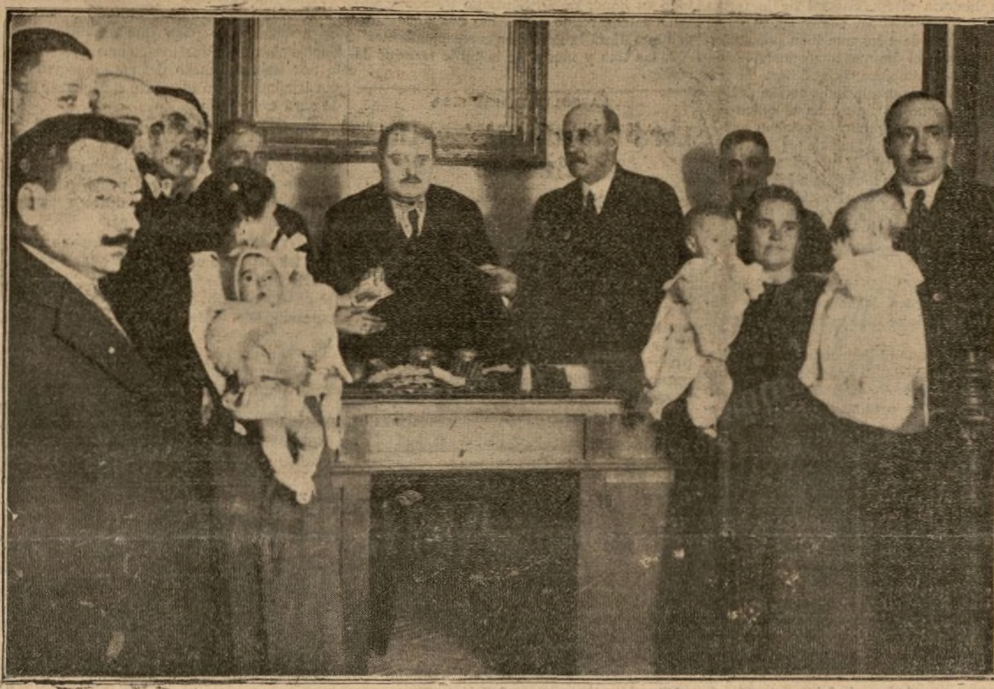
REPARTO DE PREMIOS A LAS MADRES LACTANTES