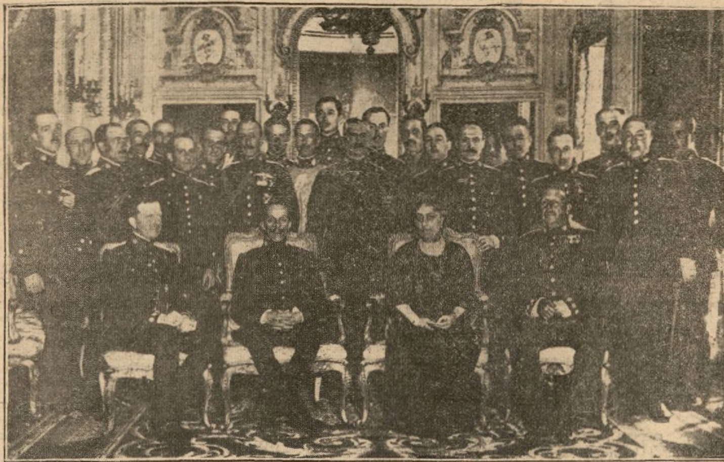
DESPUES DEL BANQUETE OFRECIDO AL CUERPO DE LA ESCOLTA REAL POR SU ALTEZA CON MOTIVO DE SU ASCENSO A GENERAL

de una nueva Asociación para la unión ruso-alemana.