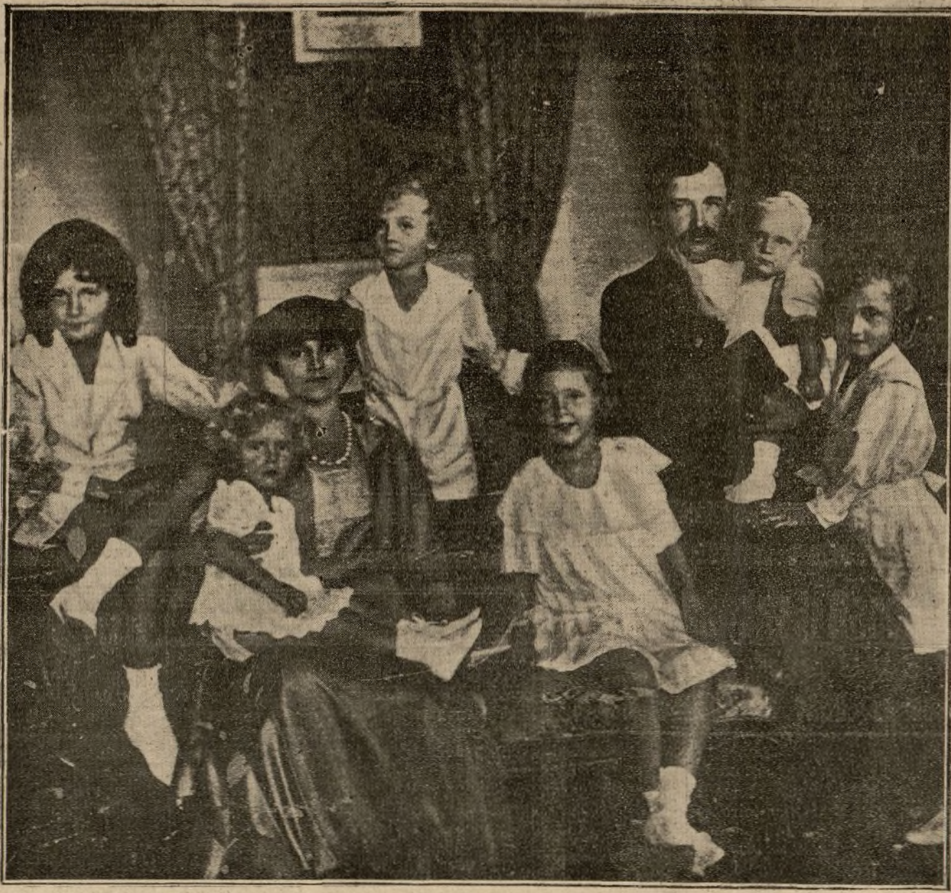
EL FINADO EX EMPERADOR CARLOS, RODEADO DE LA EX EMPERATRIZ ZITA DE PARMA Y DE SUS HIJOS

República francesa, Sr. Millerand, y el mariscal Lyautey, regresó después de almorzar a Mequinez.