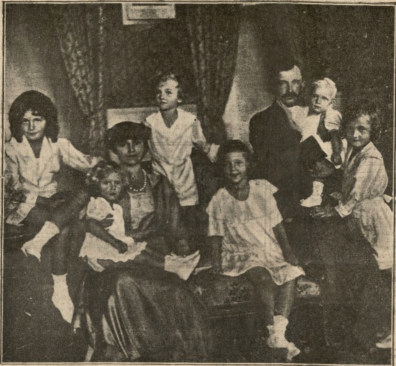
EL FINADO EX EMPERADOR CARLOS, RODEADO DE LA EX EMPERATRIZ ZITA DE PARMA Y DE SUS HIJOS

República francesa, Sr. Millerand, y el mariscal Lyautey, regresó después de almorzar a Mequinez.