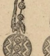
Núm. 1.631. — Aretes con cuatro brillantes y rosas. Pesetas 650.