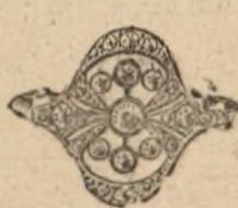
Núm. 2.224. — Sortija con siete brillantes y rosas. Pesetas 550

Todas las piezas están construidas con platino y oro de ley de 18 quilates. - Factura de garantía en todas las operaciones.