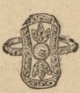
Núm. 10.007. — Sortija con un brillante y rosas. Pesetas 300

Casa fundada en 1880. La mejor garantía que existe.