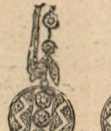
Núm. 1.631. — Aretes con cuatro brillantes y rosas. Pesetas 650