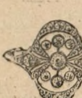
Núm. 2.224. — Sortija con siete brillantes y rosas. Pesetas 550

Todas las piezas están construidas con platino y oro de ley de 18 quilates. - Factura de garantía en todas las operaciones.