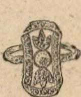
Núm. 10.067. — Sortija con un brillante y rosas. Pesetas 300

Casa fundada en 1860. La mejor garantía que existe.