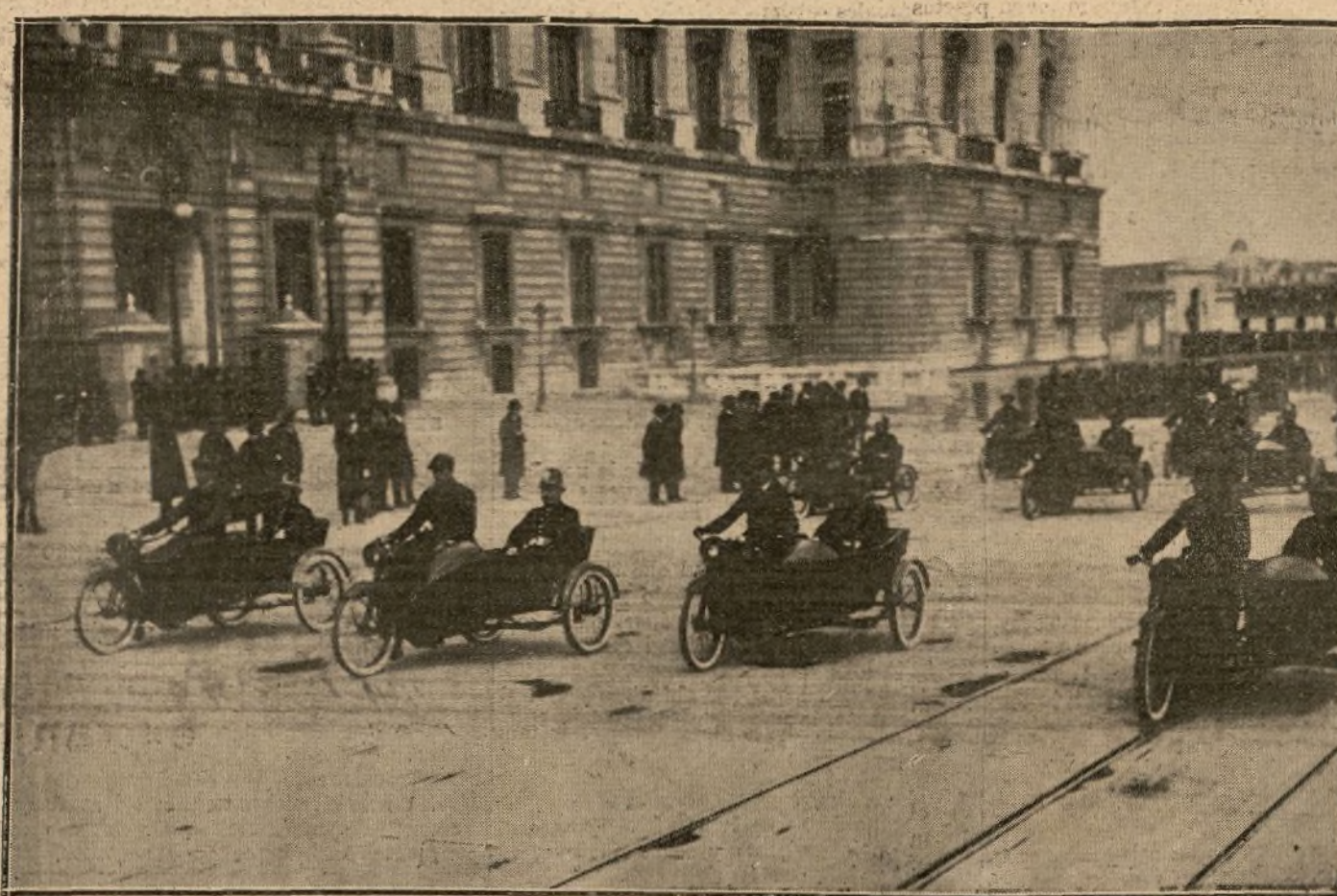
EL DESFILE ANTE PALACIO

camión, para la conducción de guardias, han llegado a Nador, desde Dar Drius, dos escuadrones de las fuerzas Regulares indígenas que tomaron brillante parte en las últimas operaciones.