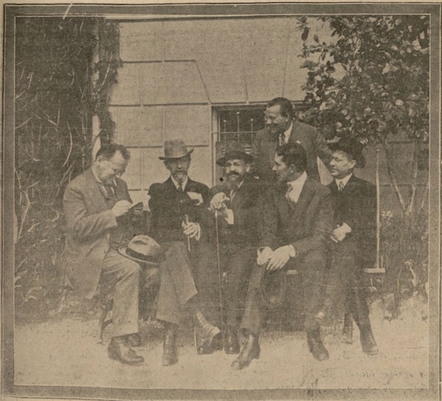
DE IZQUIERDA A DERECHA, LOS SEÑORES LITVINOF, VOROVSKY, JOFFE, GENERAL VACHOVSKY, GENERAL NOWIKY Y LIWIKIN (DE PIE).