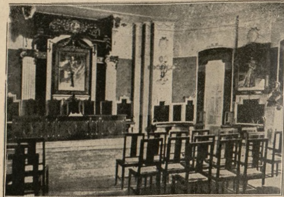
SALON DE ACTOS DEL COLEGIO INFANTA MARIA TERESA

Comenzaron las obras del referido centro de enseñanza el 18 de diciembre de 1912, y el 12 de octubre de 1914 se inauguró oficialmente dicho colegio, en el que reciben enseñanza, ajena a la milicia y democráticamente mezclados, los hijos o huérfanos de jefes, oficiales y tropa. En este colegio todo es perfecto. Allí no falta nada. Viendo los dormitorios, las clases, la enfermería, la imprenta, los cuartos de baño y duchas, el gimnasio, la capilla, el museo (sumamente curioso), el salón de actos, la biblioteca, todo, en fin, se advierte que a la persona más descontentadiza e inteligente se la pondría en el más grave apri-