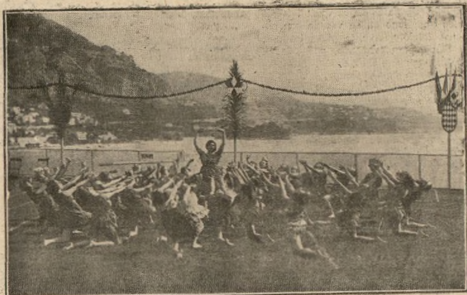
Tres interesantes momentos de las danzas rítmicas ejecutadas por las discípulas de la célebre bailarina parisíen Mile. Ronsay

pación obrera embalsamadora, la de obreros portlandistas, marmolistas, fumistas, fontaneros y vidrieros, pintores decoradores, obreros desmontistas, tejedores, poceros, colocadores de pavimentos, carpinteros de armar, papeles pintados, curtidores, de artículos de piel, cocheros, constructores de carros, obreros planchadores, profesiones y oficios varios, peones en general, socorristas de cigos, oficiales rieleros, dependientes de comercio, Sindicato de la Alimentación, dependientes barberos y peluqueros, de pescaderías, obreros de riegos, empujadores, fontaneros Sociedad El Pensamiento, carboneros, de cajas de cartón, biseladores de lunas, obreros de almacenes de lunas, vigilancia subterránea, Sociedad de carneros, chaufeurs, obreros de pan de Viena y de pan francés, Sindicato de panaderos, de pasta para sopa y de obreros pasteleros y similares.