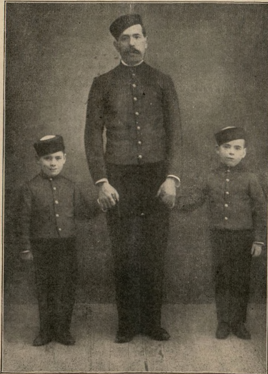
DOS HUÉRFANOS DEL COLEGIO QUE SOSTIENE EL CUERPO

El Cuerpo de la Guardia civil tiene dos nacimientos legales, perfectamente definidos