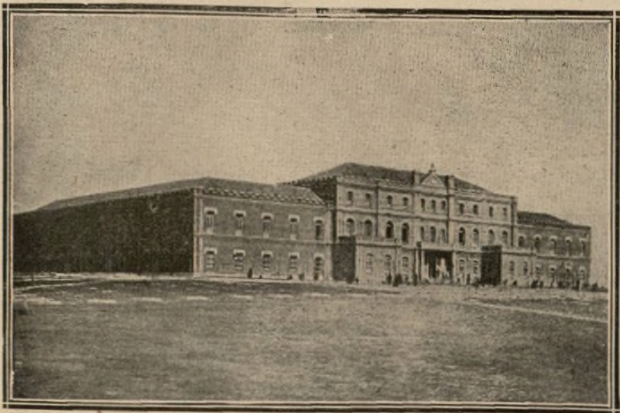
EL COLEGIO DE HUÉRFANOS DE LA GUARDIA CIVIL, INFANTA MARIA TERESA