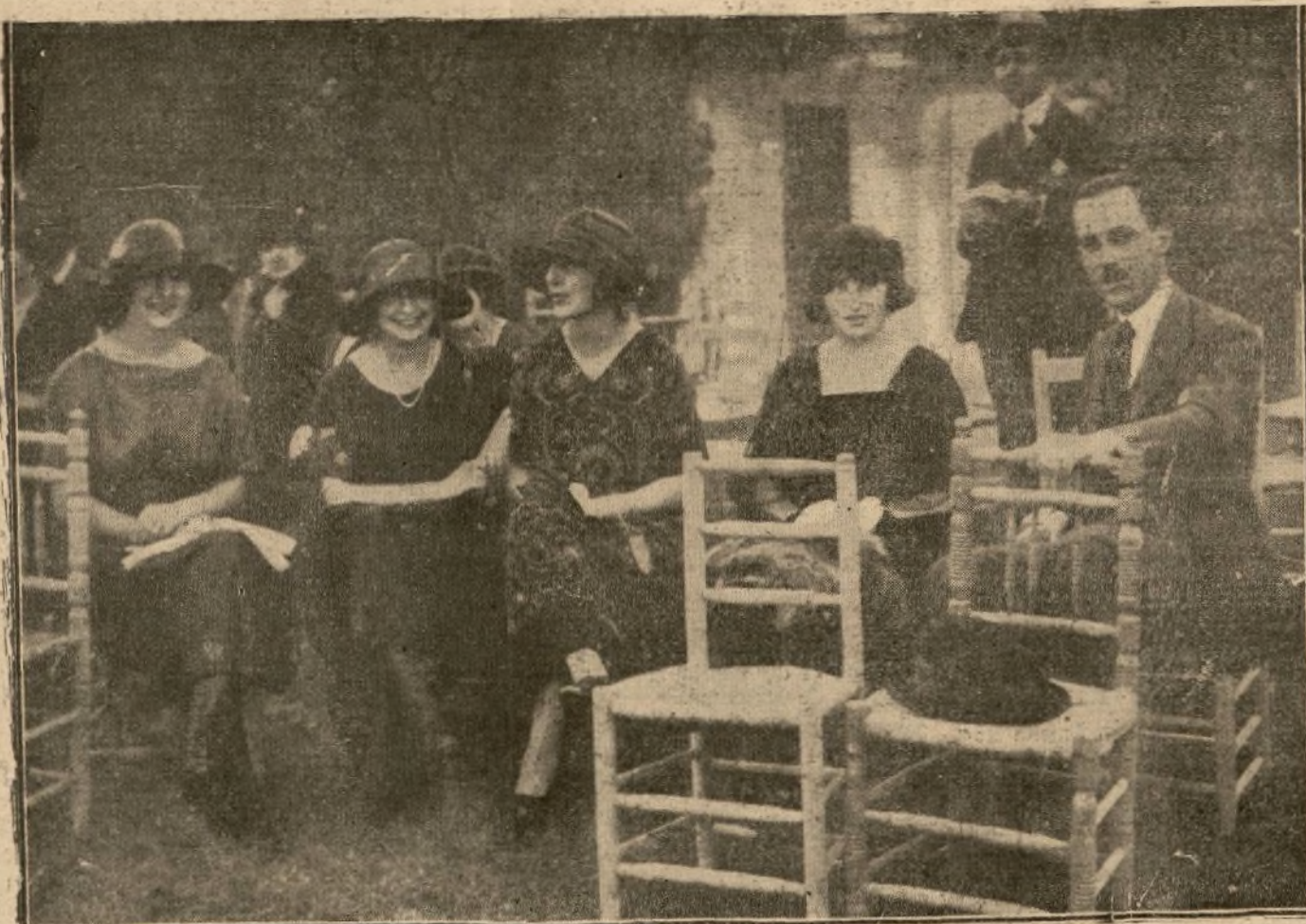
Señoritas de la aristocracia comentando el resultado de las carreras de caballos

PARIS 5. El ministro de Hacienda, Sr. De Lasteyrie, ha informado hoy ante la Comisión de Hacienda de la Cámara de diputados. Manifestó el ministro que con la reducción de las tasas e intereses de los al-