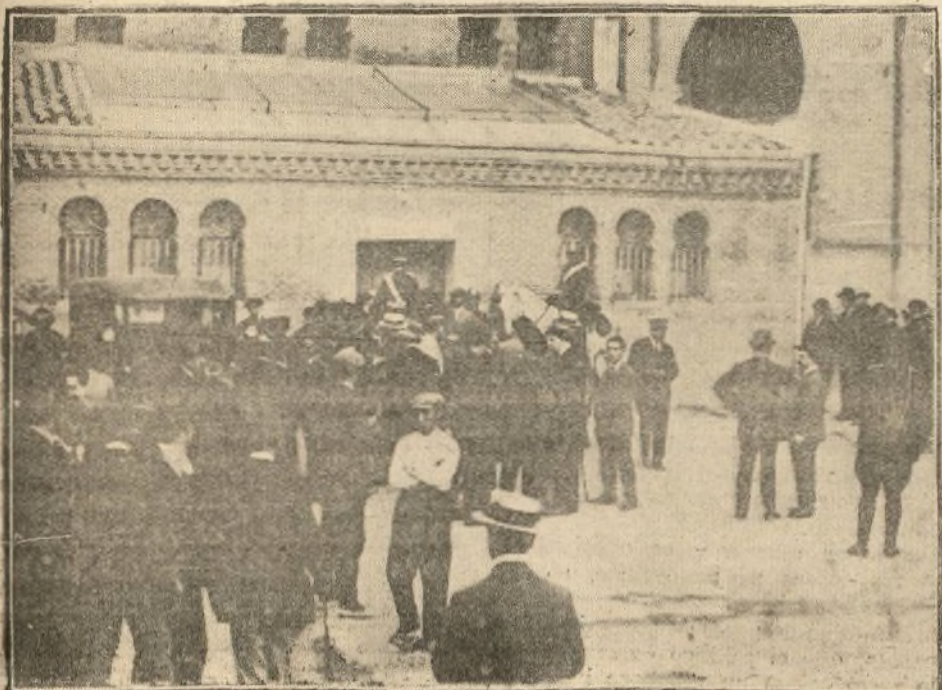
LOS PERIODISTAS ESPERANDO EL PARTE FACULTATIVO EN LA PUERTA DE LA ENFERMERIA

El infortunado torero se fué solo al to-