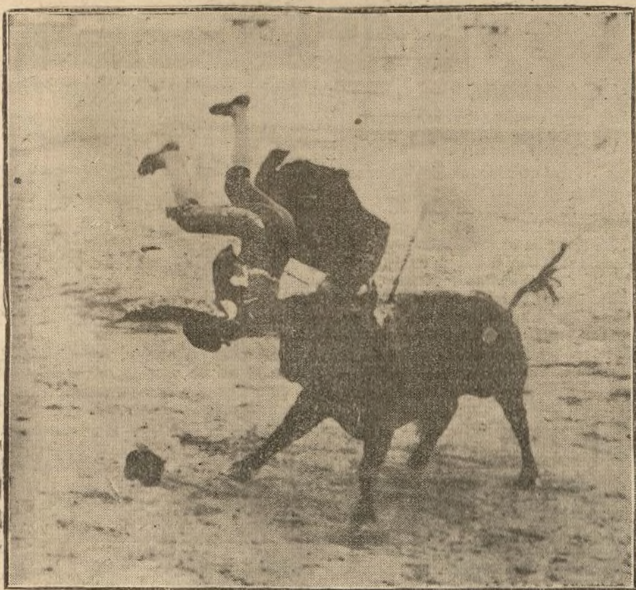
MOMENTO DE LA COGIDA DE GRANERO

Reseña de la cogida. En la enfermería. Ultimos instantes del diestro. La capilla ardiente. El público desfila ante el cadáver. Traslado de los restos a Valencia.