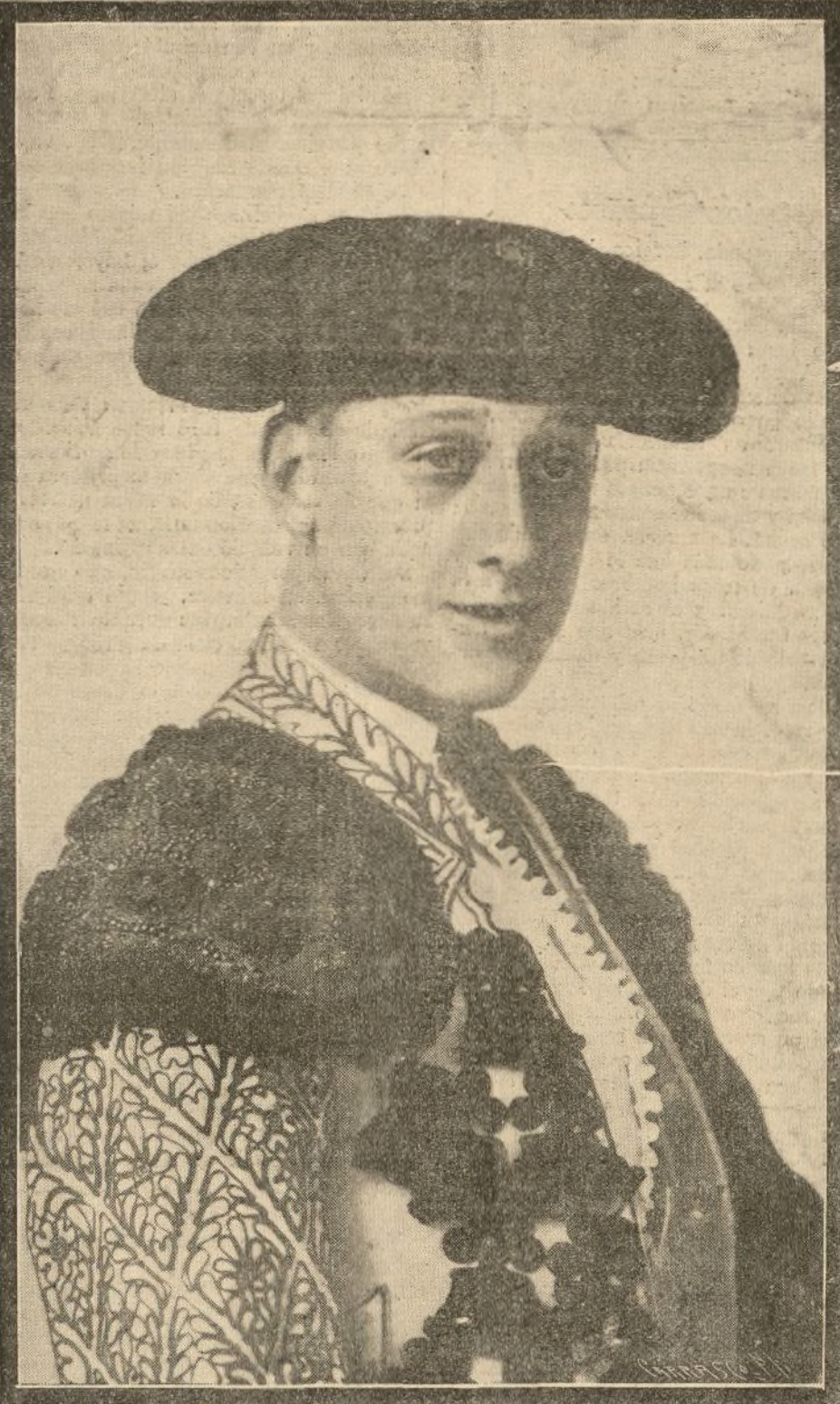
EL INFORTUNADO DIESTRO MANUEL GRANERO

Realizadas las diligencias de rigor, que cesantemente duraron un cuarto de hora, el Juzgado regresó a la Casa de Cánovas.