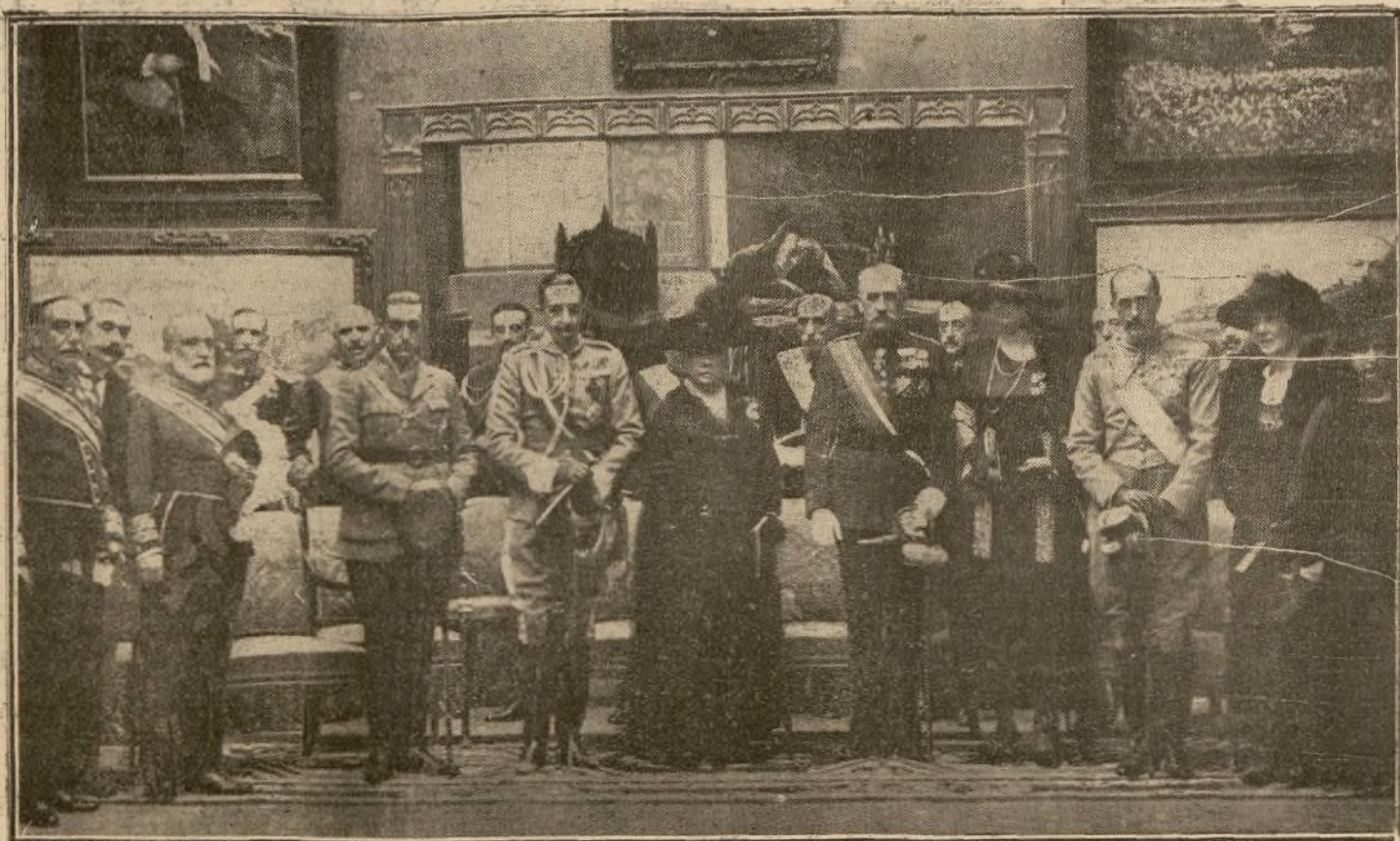
SU MAJESTAD Y ALTEZAS EN LA INAUGURACION DE LA EXPOSICION DE BELLAS ARTES

Esta mañana, a las once, ha celebrado con toda solemnidad la inauguración oficial de la Exposición Nacional de Bellas Artes, emplazada en el palacio de Exposiciones del Retiro.