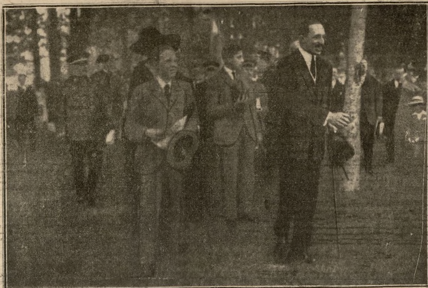
SU MAJESTAD EL REY, ACOMPAÑADO DEL PRINCIPE DE ASTURIAS Y DEL INFANTE D. JAIME, EN EL STAND

Un siglo después, llevado a la actual de la calle de Toledo.