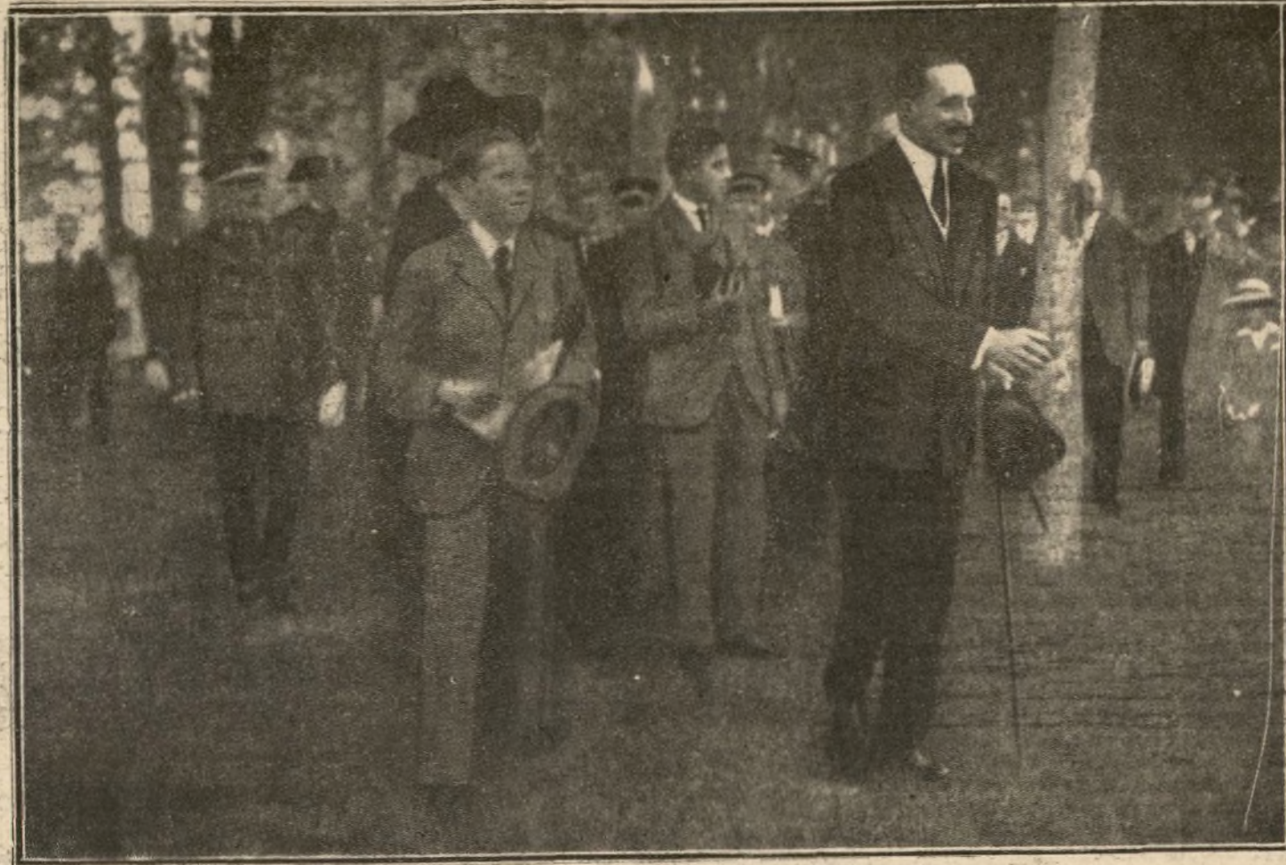
SU MAJESTAD EL REY, ACOMPAÑADO DEL PRINCIPE DE ASTURIAS Y DEL INFANTE D. JAIME, EN EL «STAND»

Un siglo después, llevado a la actual de la calle de Toledo.