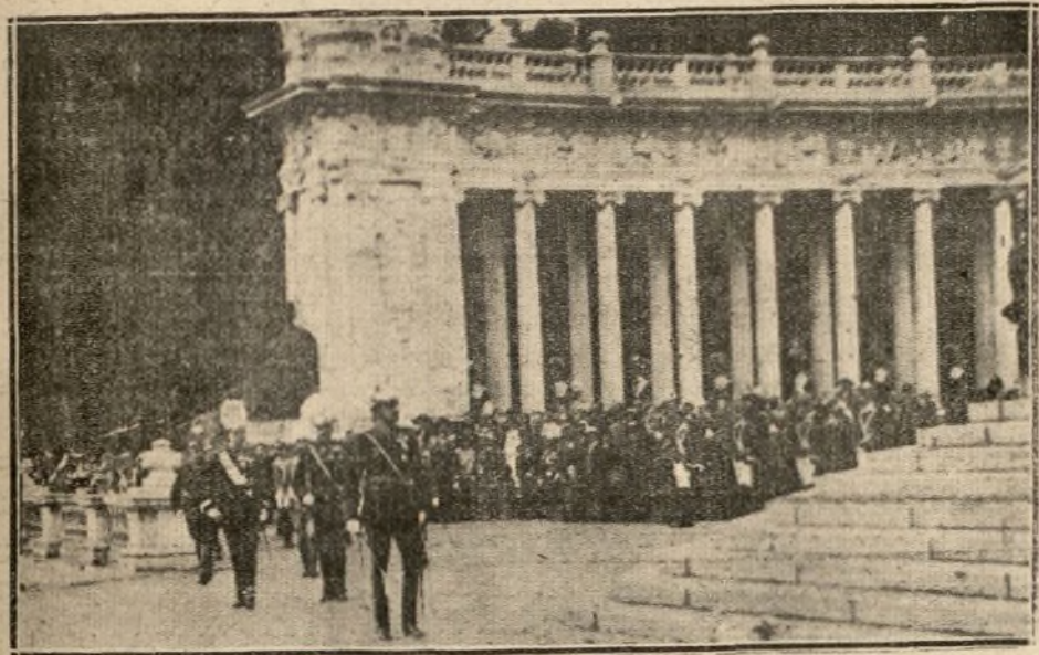
SU MAJESTAD EL REY PASANDO ANTE LA ESTATUA DE SU AUGUSTO PADRE