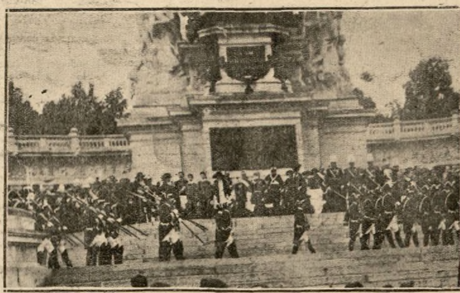
DESFILE DE LOS ALABARDEROS FRENTE AL MONUMENTO

En la entrada del Asilo rindió honores un