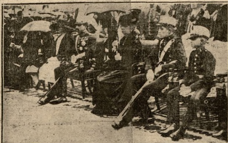
LA FAMILIA REAL EN EL ACTO DE LA INAUGURACION

A la hora en que debían hacer su entrada las fuerzas expedicionarias se suspendieron los trabajos en fábricas, talleres y