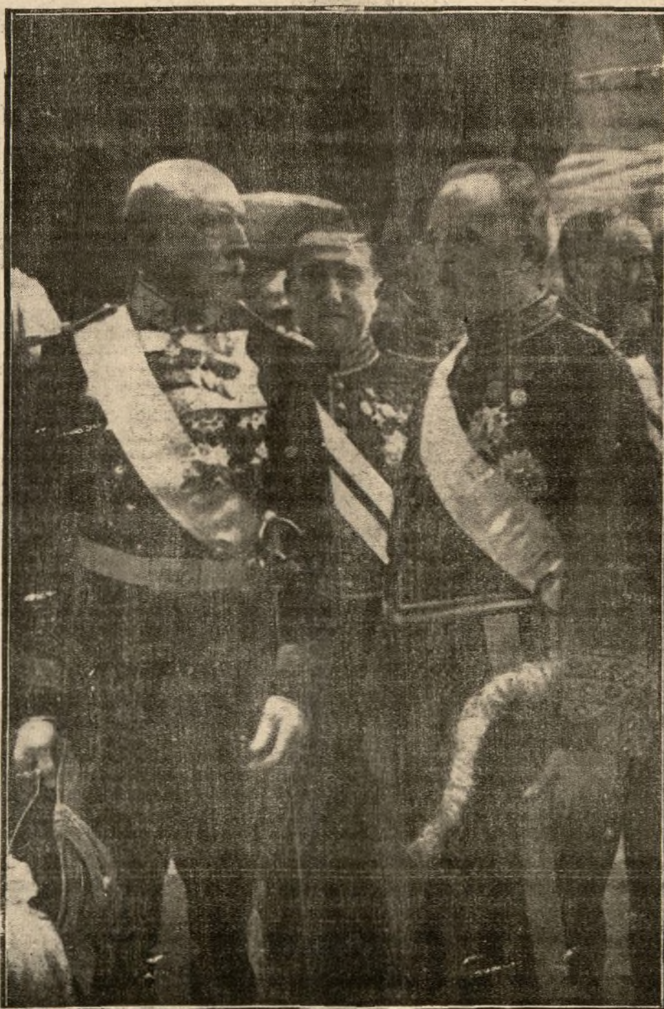
EL PRESIDENTE DEL CONSEJO Y PERSONAJES PALATINOS EN LA CEREMONIA

El rey Alejandro recibió en el desembar-