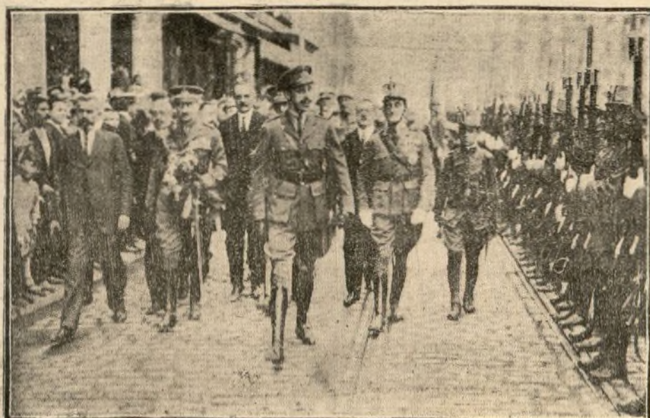
SU MAJESTAD REVISTANDO LAS FUERZAS QUE LE RINDIERON HONORES