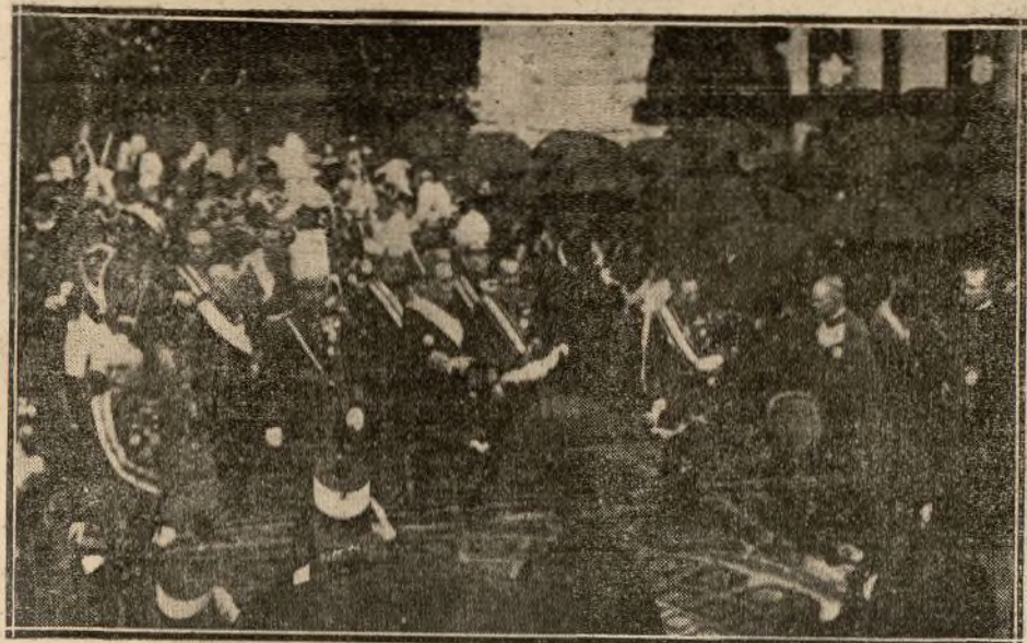
LLEGADA DEL CORTEJO AL LUGAR DE LA CEREMONIA

El bombardeo aéreo efectuado en dicho territorio sobre guardia del Alto Guardam, día 3, y en el zoco del Sbt de Beni-Uchek, fué de resultados eficaces.