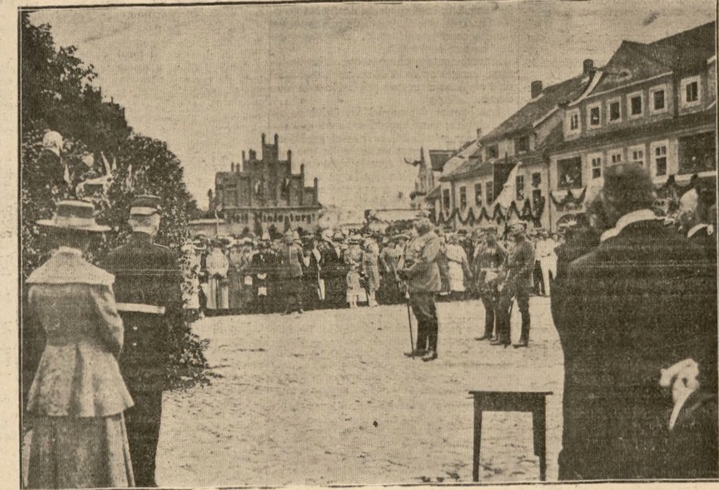
EL MARISCAL ESCUCHANDO EL DISCURSO DEL ALCALDE DE HOHENSTEIN

En la Conferencia preliminar—dijo—, con arreglo a la tesis británica, decidiese dar de lado a los principios interesados por Belgi-