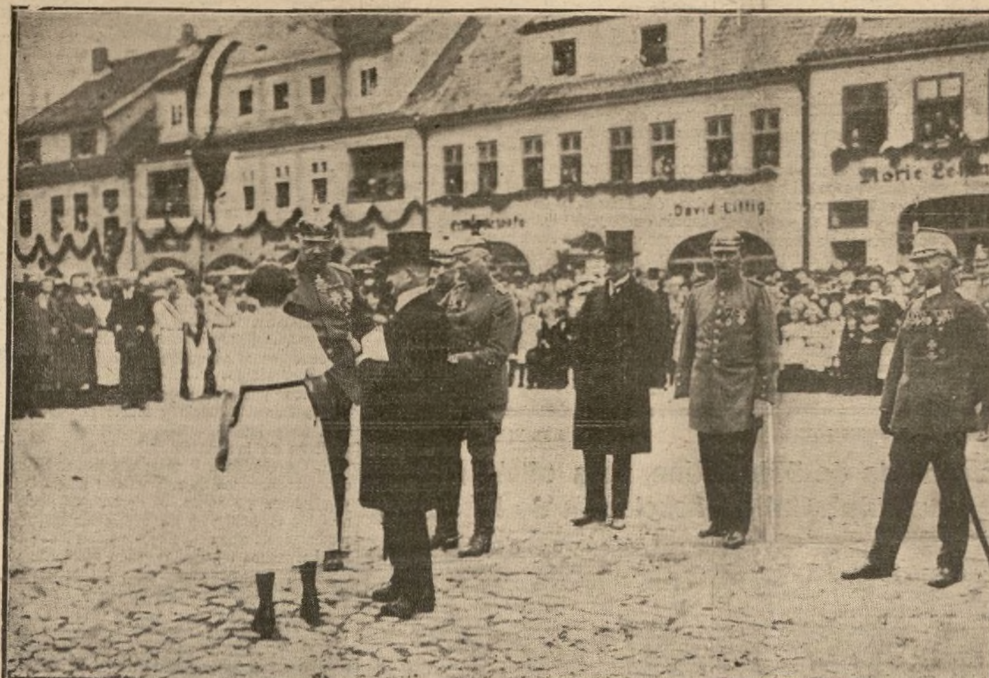
EL MARISCAL HINDENBURG EN LA PLAZA MERCADO DE LA VILLA DE HOHENSTEIN, CERCANA AL CAMPO DE BATALLA DE TANNENBERG.—UNA MUC HACHA, EN NOMBRE DE LA VILLA, LE OFRECIE UN RAMO DE FLORES

primer caso Francia cree inútil concurrir a la reunión de La Haya, dejando que los acontecimientos demuestren el error en que están los que creen posible una inteligencia con los Soviets. En el segundo caso Francia debe prepararse a la lucha, con la esperanza de atraerse a la mayoría de las naciones. La situación es bastante delicada para tomar uno de estos dos partidos sin pesar detenidamente el pro y el contra. Los acontecimientos dirán qué suerte será la que corran los franceses en este nuevo conflicto que separa otra vez fundamentalmente el criterio de los aliados en la manera de apreciar el tema de la reconstrucción de Europa.