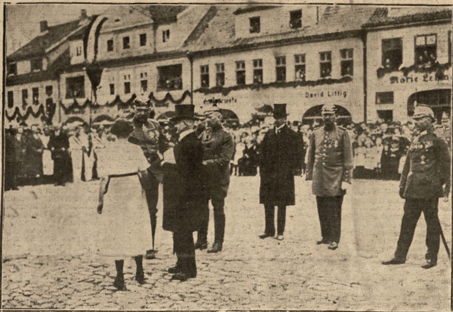
EL MARISCAL HINDENBURG EN LA PLAZA MERCADO DE LA VILLA DE HEMENSTEIN, CERCA DEL CAMPO DE BATALLA DE TANNENBERG.—UNA MUCHACHA, EN COMMEMORACIÓN DE LA VILLA, LE OFERTE UN RAMO DE FLORES

primer caso Francia cree inútil concurrir a la reunión de La Haya, dejando que los acontecimientos demuestren el error en que están los que creen posible una inteligencia con los Soviets. En el segundo caso Francia debe apretarse a la lucha, con la esperanza de atraerse a la mayoría de las naciones. La situación es bastante delicada para tomar uno de estos dos partidos sin pesar detenidamente el pro y el contra. Los acontecimientos dirán qué suerte será la que corran los franceses en este nuevo conflicto que separa otra vez fundamentalmente el criterio de los aliados en la manera de apreciar el tema de la reconstrucción de Europa.