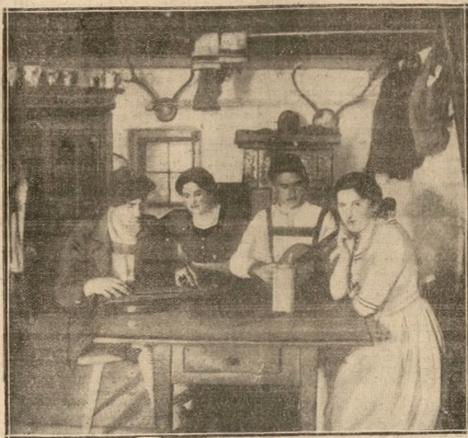
LOS ACTORES DEL DRAMA DE LA PASION ENSAYAN LA PARTE MUSICAL DEL MISMO

En los teatros llamados «al aire libre» generalmente la escena está cubierta, para facilitar el juego de los telones y de los efectos escénicos, y el público está sentado a la intemperie. En el teatro de Oberammergau es al revés. Los 4.000 espectadores que en el mismo están sentados bajo un tinglado de madera, mientras que la escena tiene por techo el cielo y por fondo las montañas cubiertas de magníficos abetos.