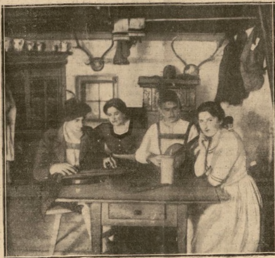
LOS ACTORES DEL DRAMA DE LA PASION ENSAYAN LA PARTE MUSICAL DEL MISMO

En los teatros llamados «al aire libre» generalmente la escena está cubierta, para facilitar el juego de los telones y de los efectos escénicos, y el público está sentado a la intemperie. En el teatro de Oberammergau es al revés. Los 4.000 espectadores que en el mismo están hallándose bajo un tinglado de madera, mientras que la escena tiene por teatro el cielo y por fondo las montañas cubiertas de magníficos abetos.