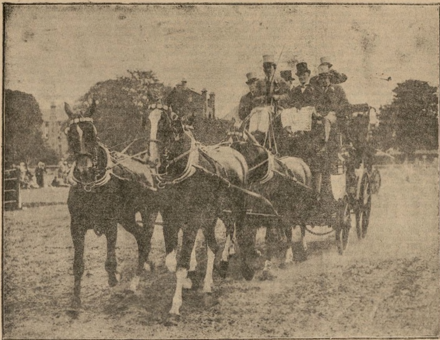
USO DE LOS ATAJES QUE HA OBTENIDO PRIMER PREMIO EN EL «MEETING» CELEBRADO EN EL FAMOSO PARQUE OLD DEER