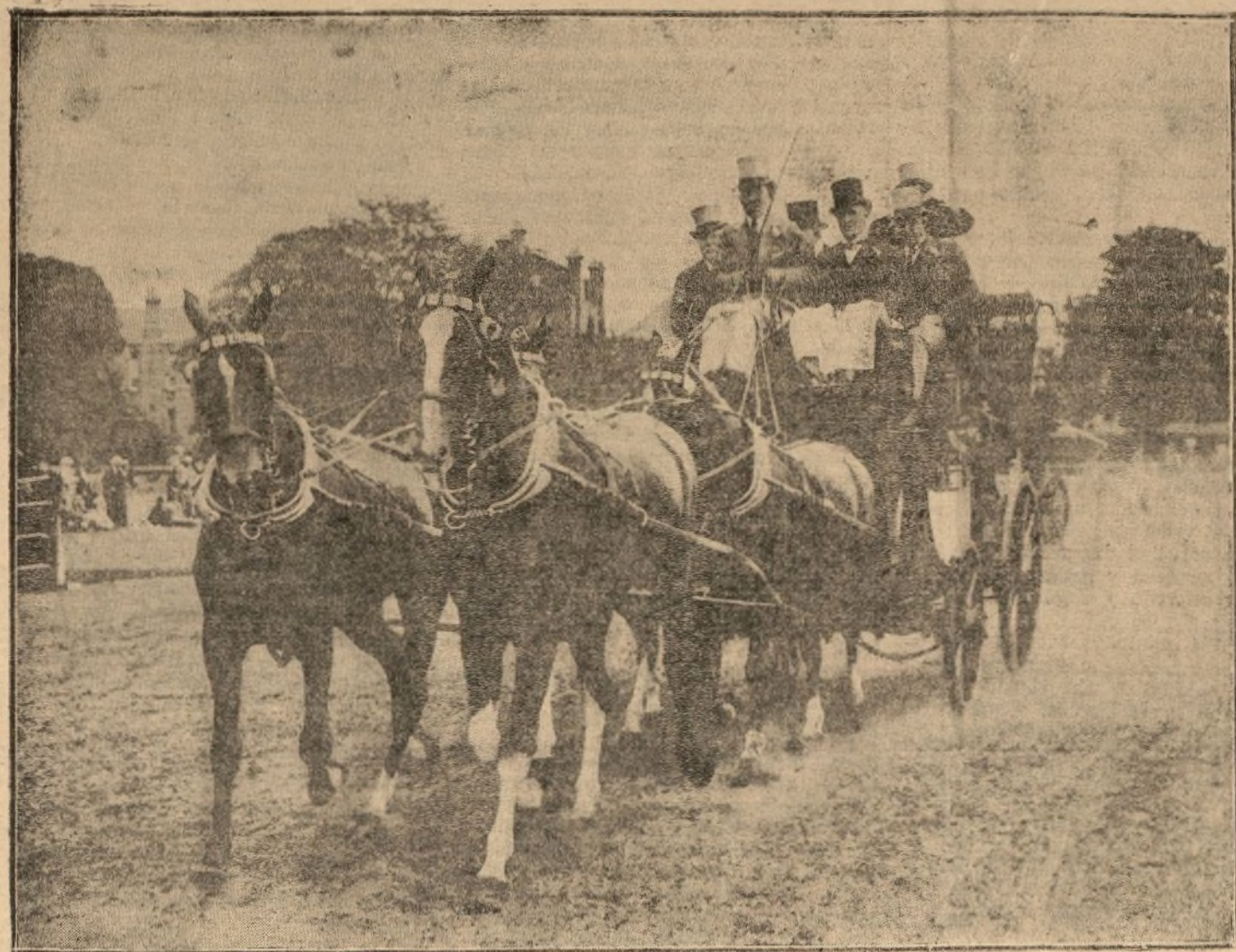
UNO DE LOS ATELAJES QUE HA OBTENIDO PRIMER PREMIO EN EL «MEETING» CELEBRADO EN EL FAMOSO PARQUE OLD DEER