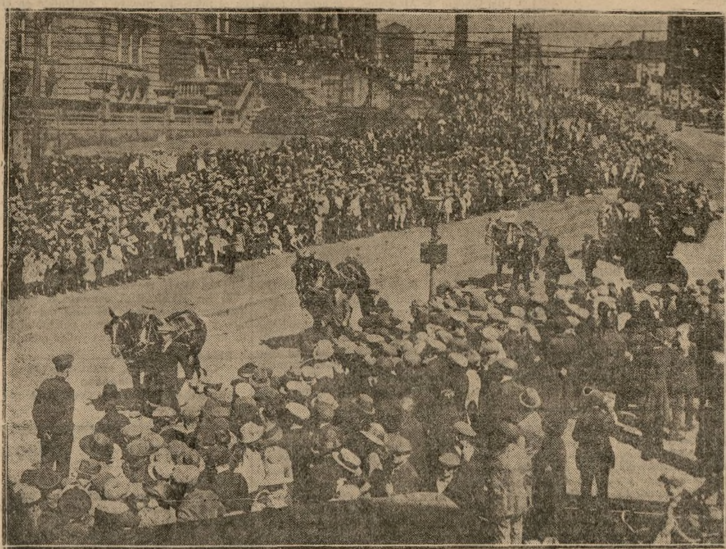
Desfile de 1.200 caballos concursantes por las calles de la ciudad.

La aplicación práctica de esta tesis dió a Rathenau materia para otro volumen, impreso en 1917, y que fué objeto de vivos comentarios. Titúlase «Las cosas que vendrán». Echándose de profeta, Rathenau nos revela cuáles serán las consecuencias de la guerra en todos los dominios de la vida social; él admitía entonces la victoria alemana, mas no partía de este supuesto. Según él, cualesquiera que fuese la paz, la vida industrial habría de estar subordinada a un plan ordenado, ni más ni menos que durante la guerra. Pero el Estado y la industria habrían de desenvolverse en un amplio espíritu democrático. Pronunciábase, pues, por el mantenimiento en época de paz, de la intervención directa del Estado en la vida industrial, por la limitación de la iniciativa privada y de los beneficios particulares, fórmula que es la del «socialismo de guerra». Los derechos de la propiedad individual revisten para Rathenau escasa importancia; tendía a su gradual desaparición; preconizaba la supresión radical del derecho de sucesión, origen primordial de la desigualdad económica.