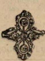
Núm. 2.234.—Sortija todo brillantes. Pésetas 850

Casa fundada en 1880. La mejor garantía que existe.