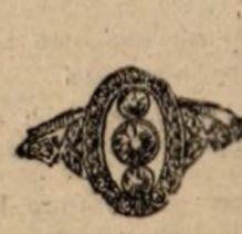
Núm. 2.226.—Sortija con tres brillantes y rosetas. Pésetas 685

Todas las piezas están construidas con platino y oro de ley de 18 quilates. - Factura de garantía en todas las operaciones.