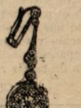
Núm. 1.635.—Aretes con veintidós brillantes y rosetas. Pésetas 1.100