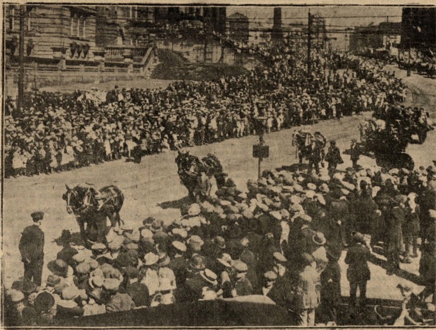
Desfile de 1.200 caballos concursantes por las calles de la ciudad.

La aplicación práctica de esta tesis dio a Rathenau materia para otro volumen, impreso en 1917, y que fue objeto de vivos comentarios. Titúlase «Las cosas que vendrán». Echándose de profeta, Rathenau nos revela cuáles serán las consecuencias de la guerra en todos los dominios de la vida social; él admitía entonces la victoria alemana, mas no partía de este supuesto. Según él, cualesquiera que fuese la paz, la vida industrial habría de estar subordinada a un plan ordenado, ni más ni menos que durante la guerra. Pero el Estado y la industria habrían de desenvolverse en un amplio espíritu democrático. Prometiábase, pues, por el mantenimiento de la época de paz, de la intervención directa del Estado en la vida industrial, por la limitación de la iniciativa privada y de los beneficios particulares, fórmula que es la del socialismo de guerra. Los derechos de la propiedad individual revisten para Rathenau escasa importancia; tendía a su gradual desaparición; preconizaba la supresión radical del derecho de sucesión, origen primordial de la desigualdad económica.