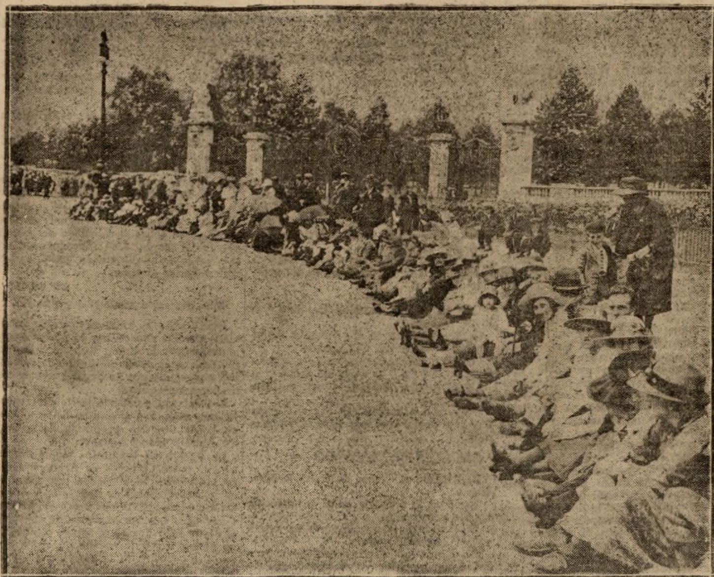
La vuelta del príncipe de Gales a Londres.—La multitud esperando el paso del heredero de la corona de Inglaterra.