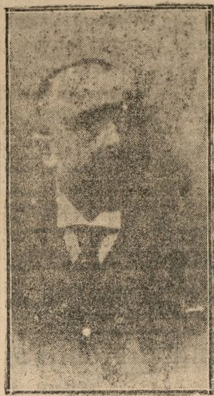
DON JUAN DE LA CIERVA

Desde que el general Berenguer, interro- gado en el Senado por los periodistas, reser- vó la respuesta acerca de su vuelta a Ma- rruecos, comenzó a circular el rumor de que había dimitido la alta Comisaría y que las palabras que se atribuyen a sus amigos al decir que el dimitir ahora significaría un abandono de puesto ante el enemigo, se re- ferían exclusivamente al mando como ge- neral en jefe de las tropas, cargo distinto, aun- que, naturalmente, unido en la misma per- sona al de alto comisario de España en Ma- rruecos.