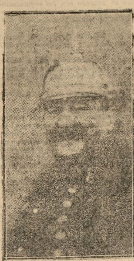
EL GENERAL BERENGUER

Con arreglo a la legislación vigente, el se- cretario de la Alta Comisaría—hoy, el señor