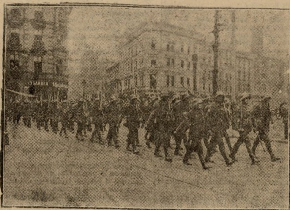
Entrada de las tropas polacas en Katowice