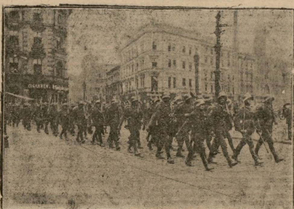
Entrada de las tropas polacas en Katowice