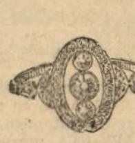
Núm. 2.286.—Sortija con tres brillantes y rosas. Pesetas 505

Todas las piezas están construidas con platino y oro de ley de 18 quilates. - Factura de garantía en todas las operaciones.