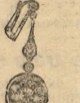
Núm. 1.635.—Aretos con veintidós brillantes y rosas. Pesetas 1.100