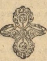
Núm. 2.234.—Sortija todo brillantes. Pesetas 550

Casa fundada en 1880. La mejor garantía que existe.