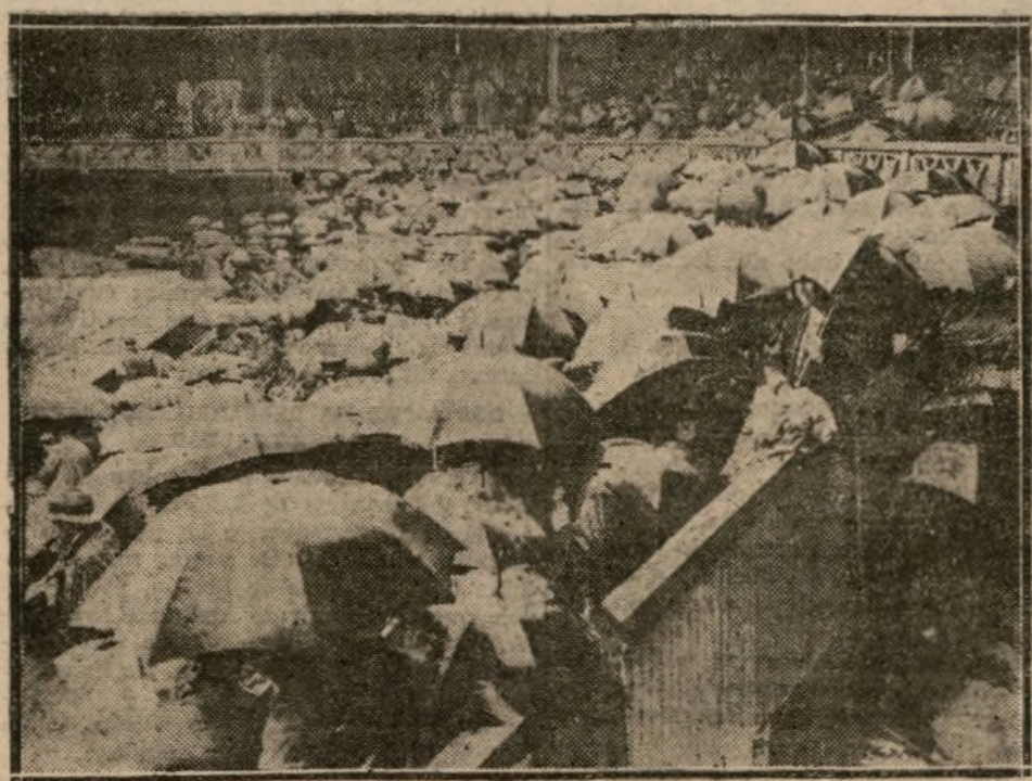
El público de Wimbledon presenciando un partido de tenis, bajo una lluvia copiosa