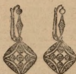
Núm. 1.425.-Aretes con dos brillantes y rosas. Pesetas 365

Casa fundada en 1880. La mejor garantía que existe.