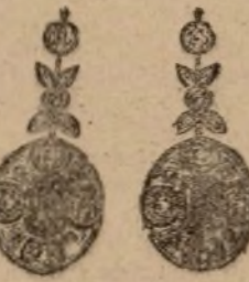
Núm. 1.625.-Aretes con veinte brillantes, rosas y centro zafiro. Pesetas 1.100

Todas las piezas están construidas con platino y oro de ley de 18 quilates. - Factura de garantía en todas las operaciones.