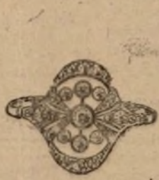
Núm. 2.224.-Sortija con siete brillantes y rosas. Pesetas 550