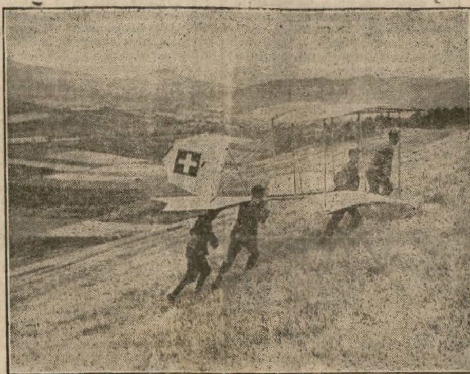
Los aparatos son llevados a la cumbre de Puy de Combagrasse