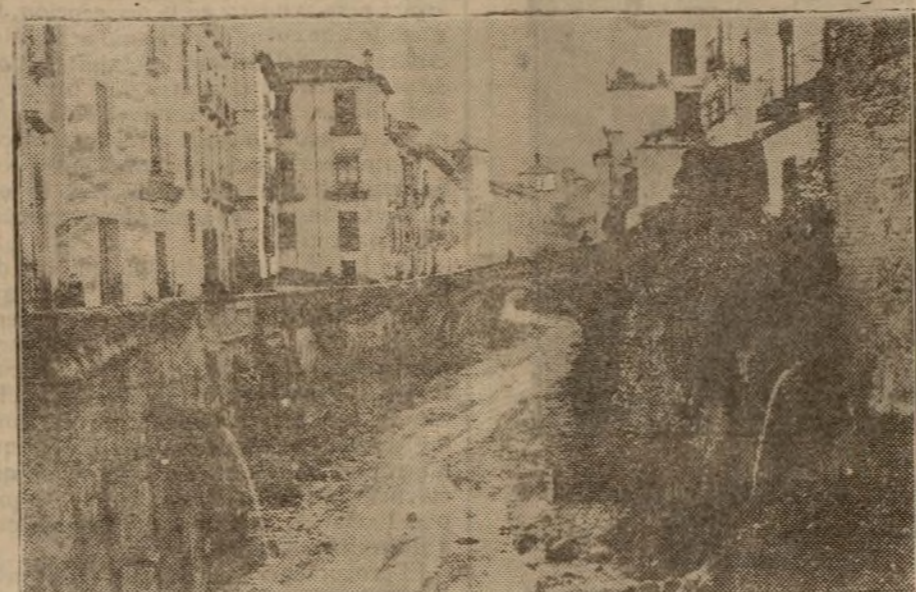
GRANADA.—Carretera del Darro.