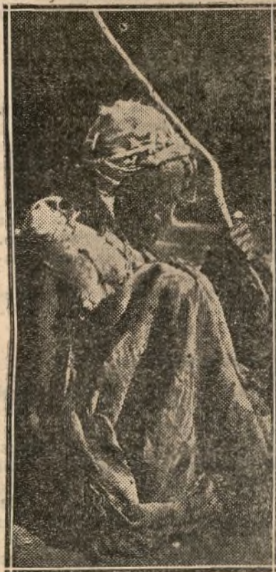
Tipo de San.ón mendicante.