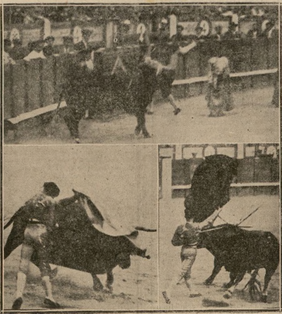
Cogida de Gavira. —Andalúz toreando de capa. —Carralafuente pasando de muleta.