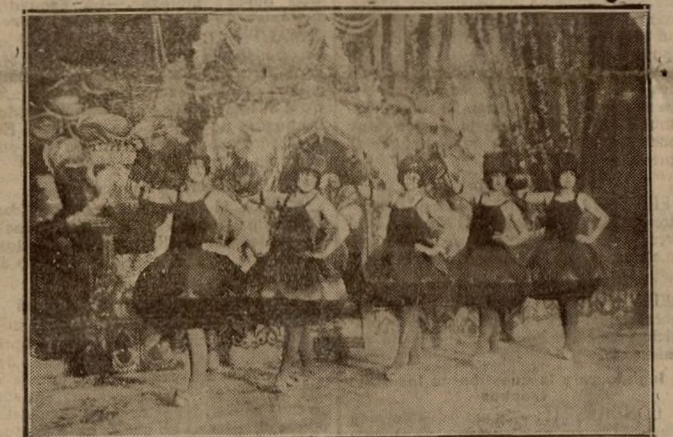
Una escena de la opereta «Una noche en el Paraíso», estrenada con gran éxito en Buenos Aires.

En este número, la Empresa Rey-Losada «echó el resto», presentándolo con 50 mujeres, 11 de ellas con traje de perlas luminosas y ocho negras que danzaban al compás de la