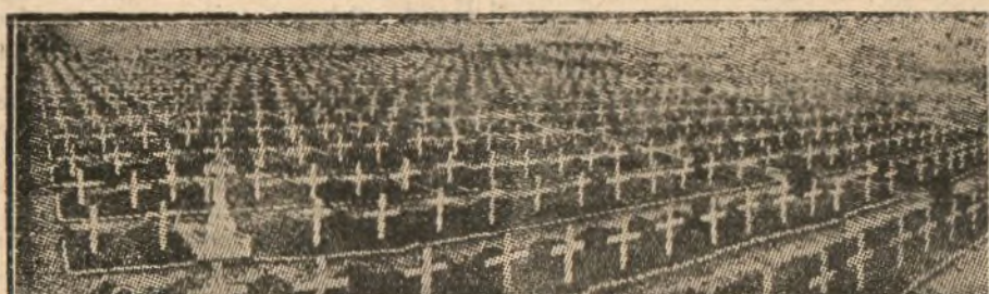
La Prensa de Londres publica esta fotografía con el siguiente comentario: «No hay todavía bastantes soldados británicos sepultados en la tierra de Oriente?».