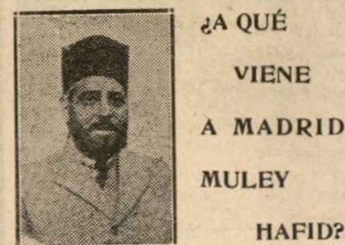
¿A QUÉ VIENE A MADRID MULEY HAFID?

Cualquier medida de rigor que ahora se tomase contra el Sr. Piliés, nos parecería injusta, tan injusta como el no haberle hecho dimitir a raíz de su primera equivocación, que fué antes de estallar la primera huelga de los funcionarios de Correos.