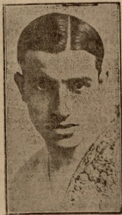
Juan Belmonte el ex torero

Exterioriza Belmonte su pensamiento de irse.