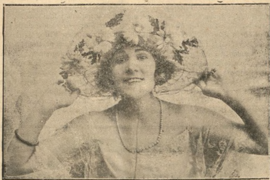
Amparito Martí, primera actriz del teatro Cómico