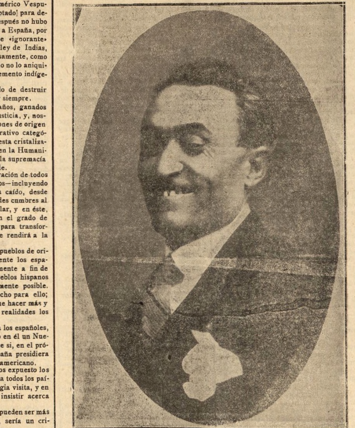
Pedro Zorrilla, primer actor del teatro Cómico