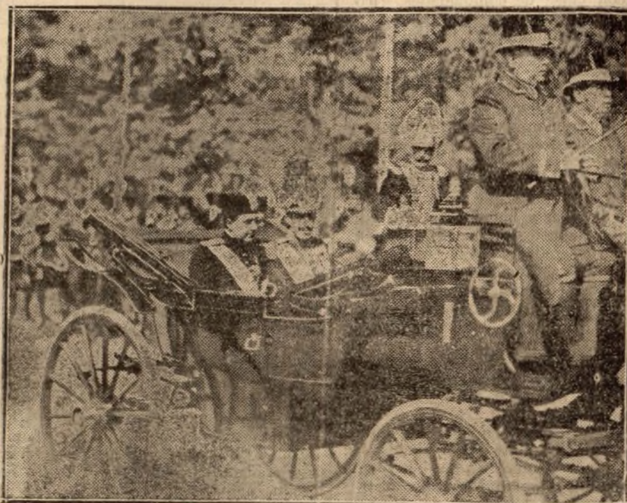
Ahmad Kadjar y Don Alfonso, dirigiéndose a Palacio