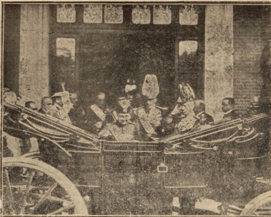
El Sha de Persia, acompañado por el Rey, a la salida de la estación del Norte

Del primer vagón descendió Su Majestad Ahmed-Chad-Kadjar, que vestía uniforme militar de su país. Don Alfonso se adelantó y, efusivo, estrechó la mano del Soberano persa, que correspondió sonriendo al agasajo. Seguidamente presentó Su Majestad a las personalidades que le acompañaban.