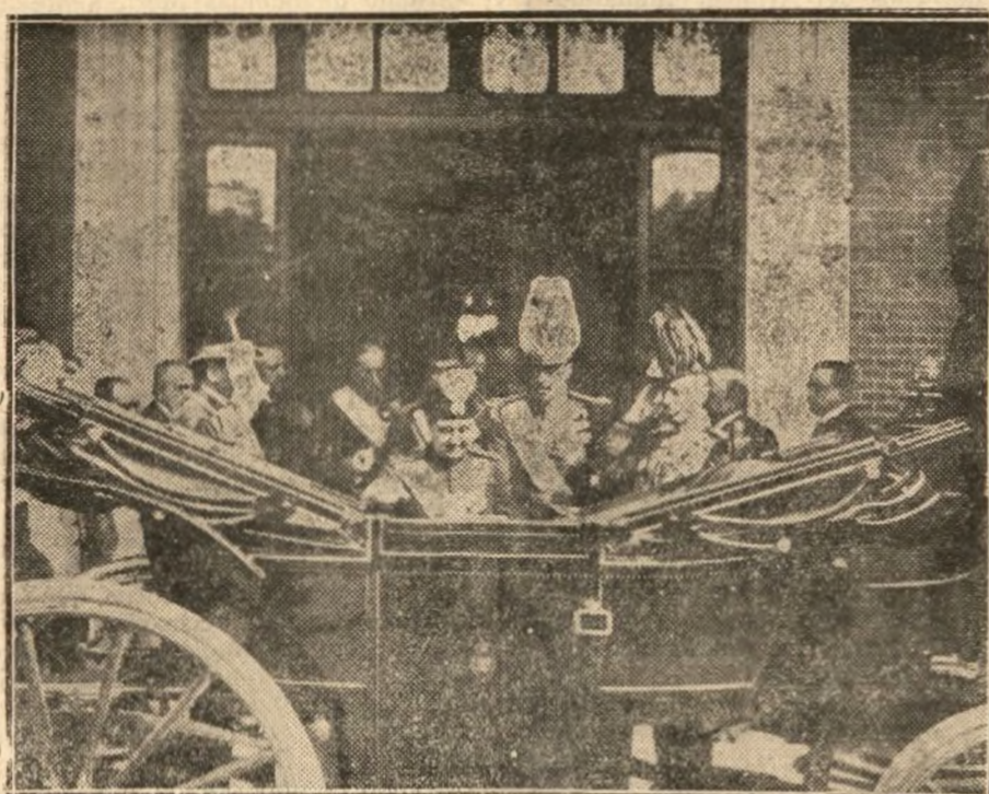
El Sha de Persia, acompañado por el Rey, a la salida de la estación del Norte

Del primer vagón descendió Su Majestad Ahmed-Chad-Kadjar, que vestía uniforme militar de su país. Don Alfonso se adelantó y, efusivo, estrechó la mano del Soberano persa, que correspondió sonriendo al agasajo. Seguidamente presentó Su Majestad a las personalidades que le acompañaban.