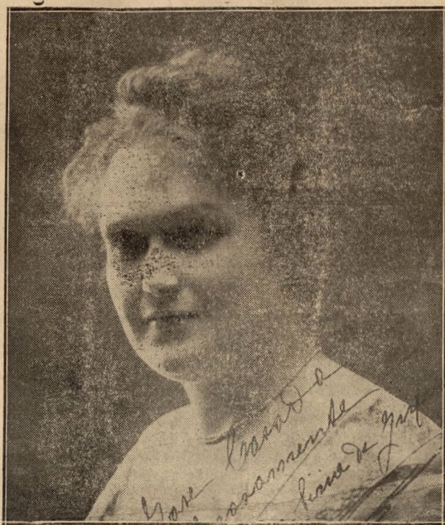
Ana de Siria, actriz del teatro Español