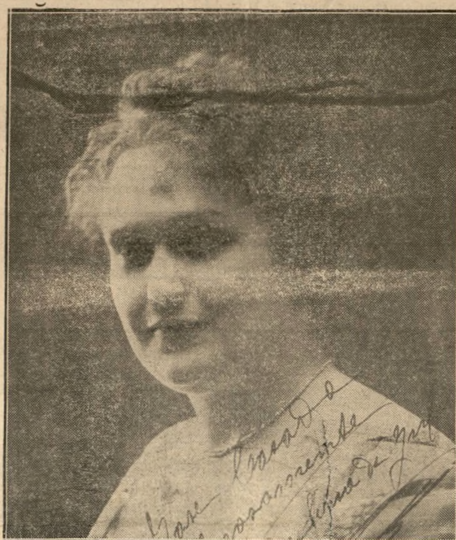
Ana de Siria, actriz del teatro Español