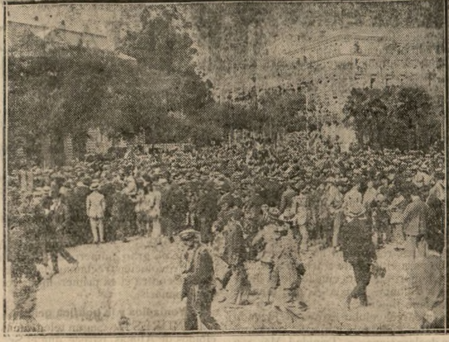
Los Colegios agrupados bajo sus banderas, desfilan ante el monumento