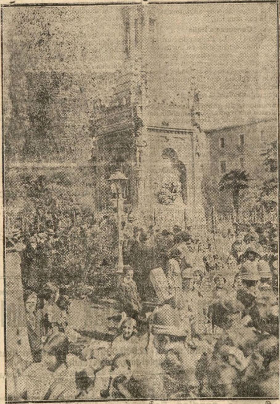
Los niños depositan coronas y ramos de flores ante el monumento de Colón

Se amplía en un mes el plazo para que los reclutas acogidos a los beneficios del capítulo XX de la Ley de Reclutamiento puedan abonar los segundos y terceros plazos ya vencidos de cuota militar.