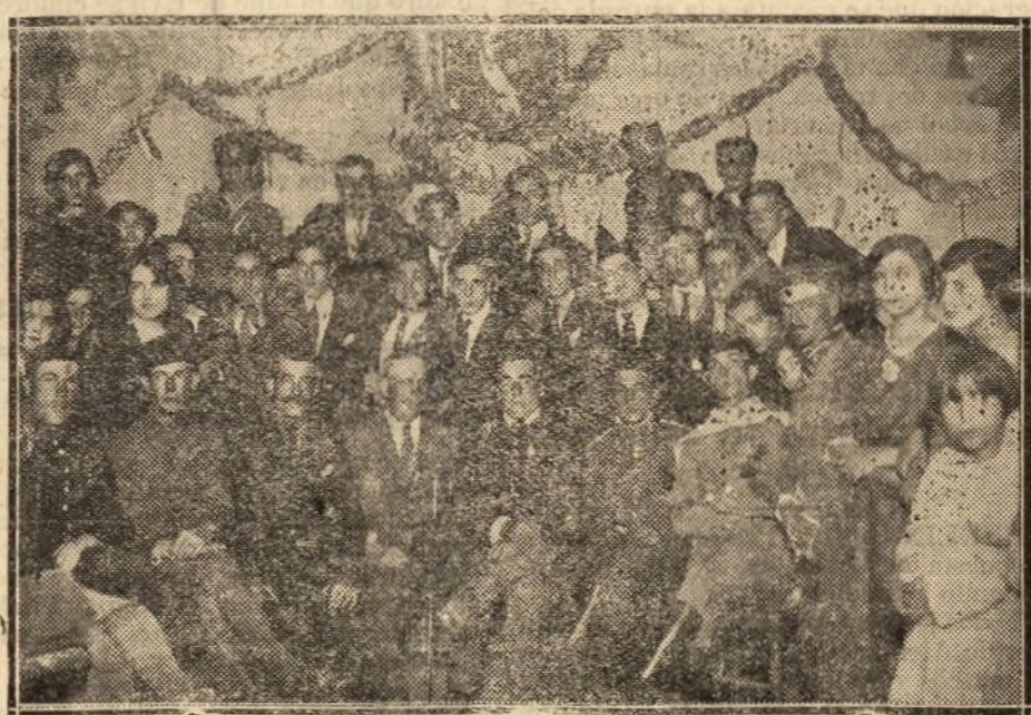
La Fiesta de la Raza en el barrio de Doña Carlota

Por lo tanto, si hubiésemos retirado nuestras tropas como lo hicieron Francia e Italia, los kemalistas hubiesen ocupado países.