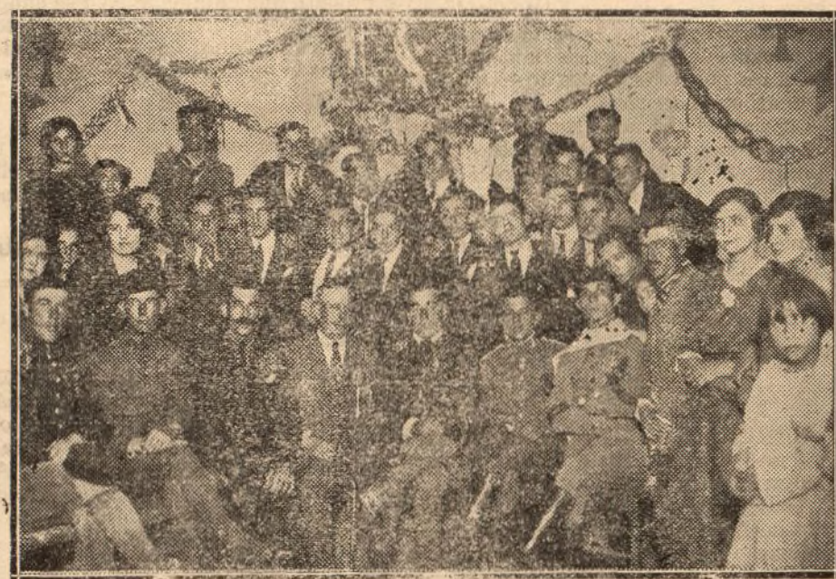
La Fiesta de la Raza en el barrio de Doña Carlota

BUENOS AIRES 16.—El Sr. De Alvear ha dirigido una proclama al Ejército y la Marina argentinas, en la que hace constar que la República Argentina, iniciadora y creadora de la independencia de gran parte de América, debe vivir en armonía con las naciones hermanas para prosperar, sin que sus aspiraciones dañen ni menoscaben los derechos de los demás países.