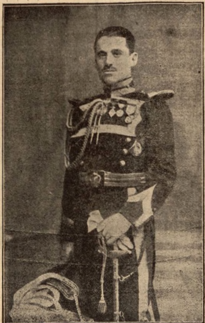
El marqués de Villabragima