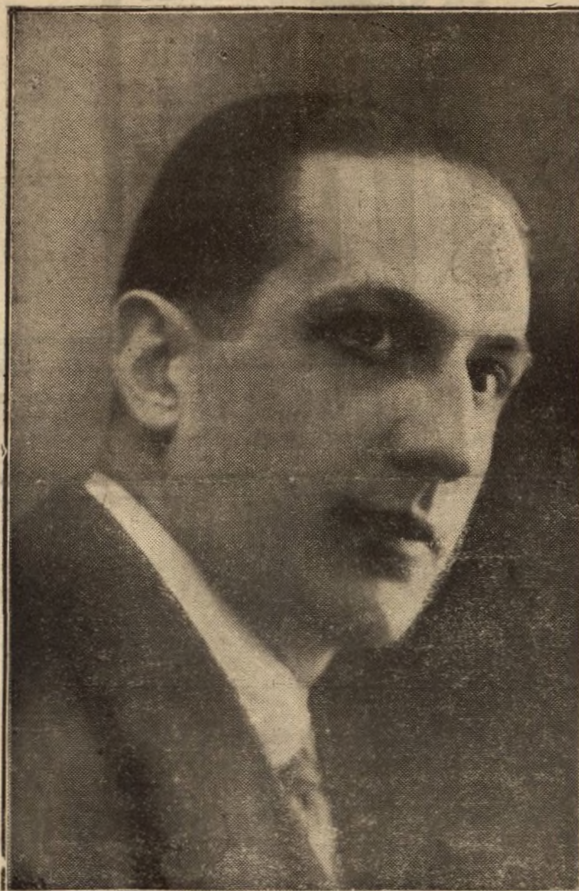
El notable actor Luis Peña