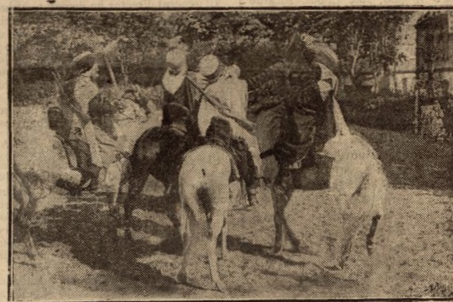
Gumaris franceses, de Casablanca

donde alentaba una rebelión, y el resultado excedió de los cálculos más optimistas. El «gum», tropa de vanguardia y de flanco, salvó a los franceses de muchos contratiempos y fué la patrulla intermedia entre la rebelión y los sumisos, patrulla que recibió todos los golpes y que siempre se portó bravamente, abnegadamente, realizando no sólo una brillante acción guerrera, sino una provechosa labor política que ha contribuido