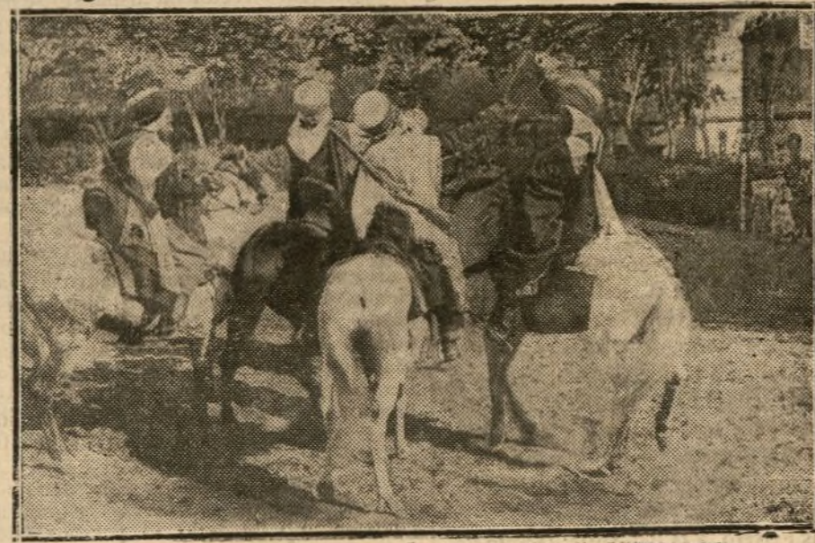
Gumaris franceses, de Casablanca

donde alentaba una rebelión, y el resultado excedió de los cálculos más optimistas. El «gum», tropa de vanguardia y de flanco, salvó a los franceses de muchos contratiempos y fue la patrulla interpuesta entre la rebelión y los sumisos, patrulla que recibió todos los golpes y que siempre se portó bravamente, abnegadamente, realizando no sólo una brillante acción guerrera, sino una provechosa labor política que ha contribuido