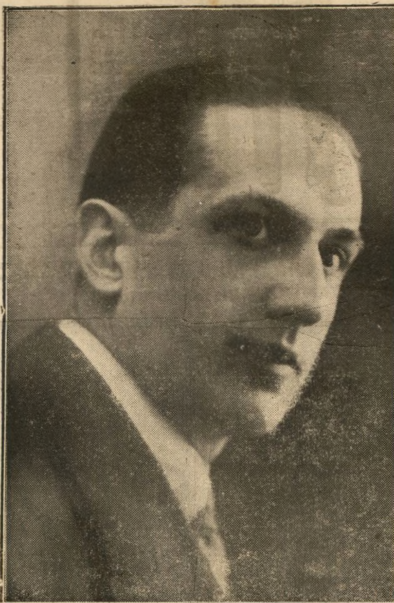
El notable actor Luis Peña