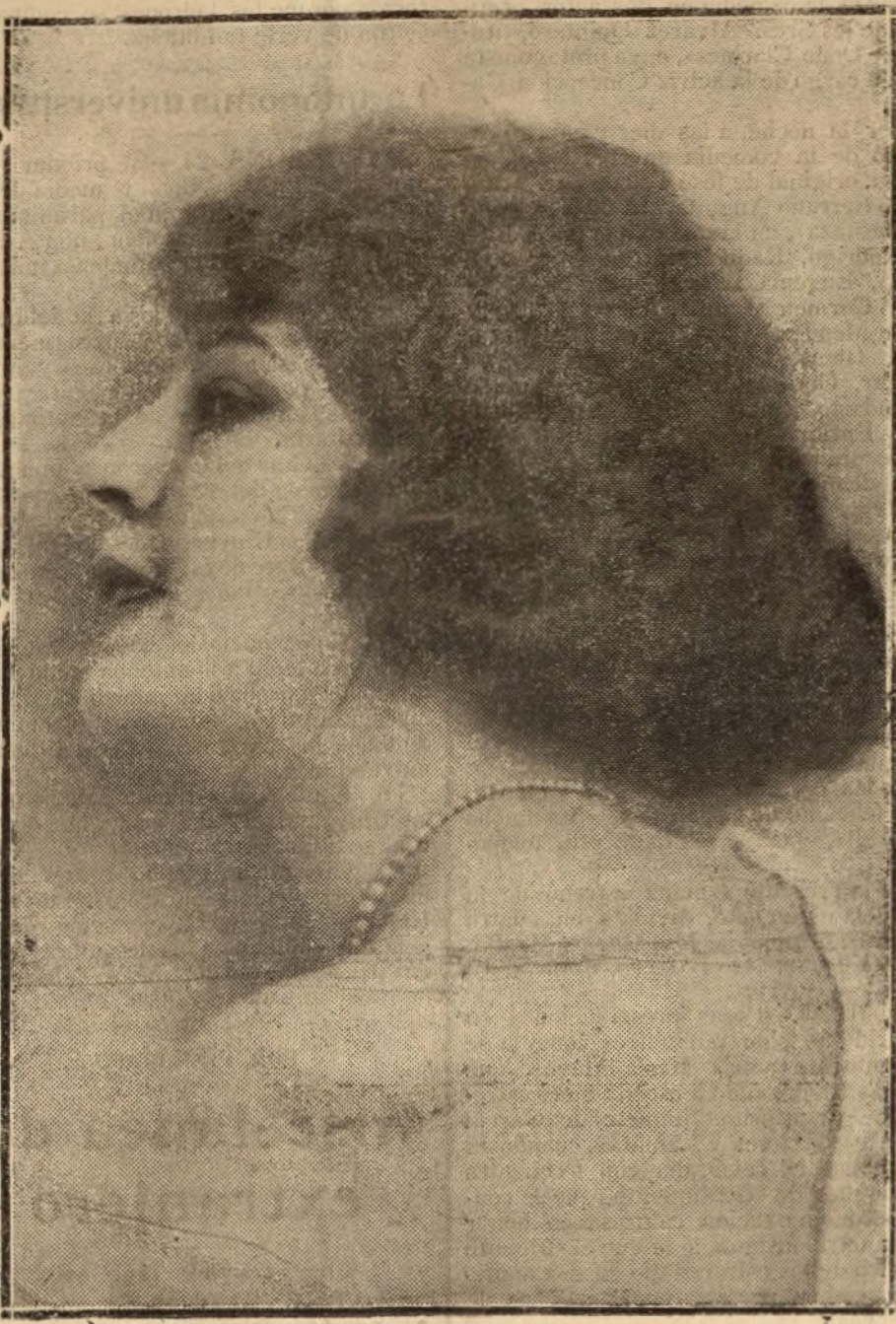
Carmen Ruiz Moragas, bella y notable actriz