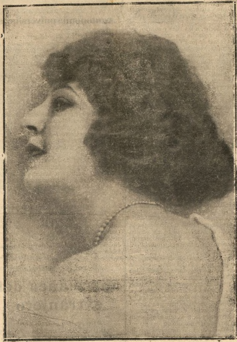
Carmen Ruiz Moragas, bella y notable actriz